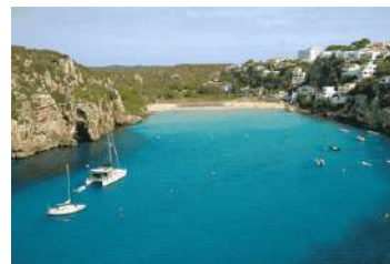
7. Cala en Porter