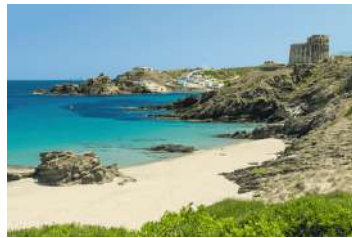
2. Cala Mesquida ▶