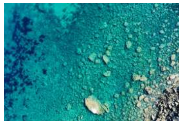
6. Cala Caldes ▶