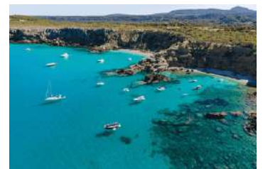
8. Macar de la Llosa