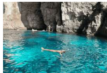
6. Cala Coves