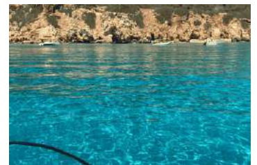
8. Son Bou o Binigaus