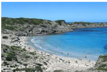
5. Cala Tortuga ▶