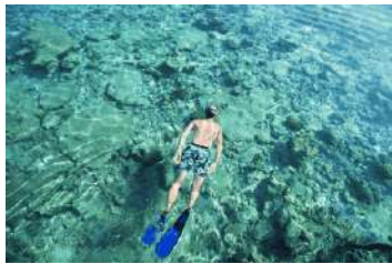
1. Cap Negre ▶