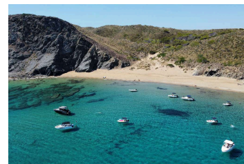
7. Playa Mongofra ▶