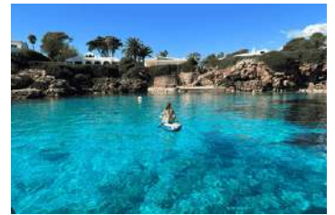
4. Caló blanc o Binisafuller