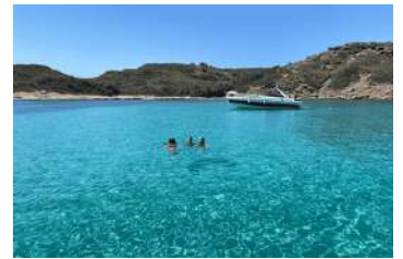
4. Cala Rambles