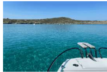
3. Illa Colom ▶